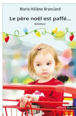
Le Père Noël est paffé... Éditions du Poutan • 2017