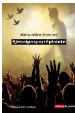
#Jenaipasportéplainte Éditions du Poutan • 2016